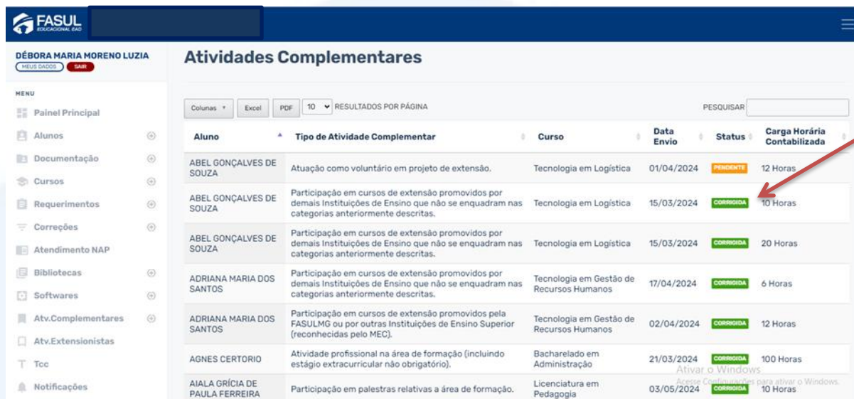
Figura 2 - Painel de validação das atividades complementares.